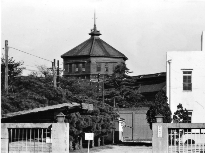
宮城刑務所 六角塔

宮城刑務所の前身である宮城集治監は西 南戦争の国事犯の収容を目的に明治十二年 に落成しました。俗に六角大学の愛称で仙 台市民に親しまれましたが、近代建設の房 舎交代に伴い明治の貴重な建物として明治