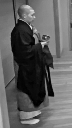
フル装とは「搭袈裟帶坐具着ベッス」のことです。

回廊清掃が終り直歳寮に戻ると、事務所当番から「侍真寮から連絡があつて応量器・袈裟行季・作務衣・絡子・メモ道具持参、フル装で侍真寮に九時までに来ることだつてさ。」と告げられました。このフル装というのは搭袈裟帶坐具、ベッス着用という意味です。つまりは檀信徒皆様方のご法事をお勤めするときと同じ威儀です。